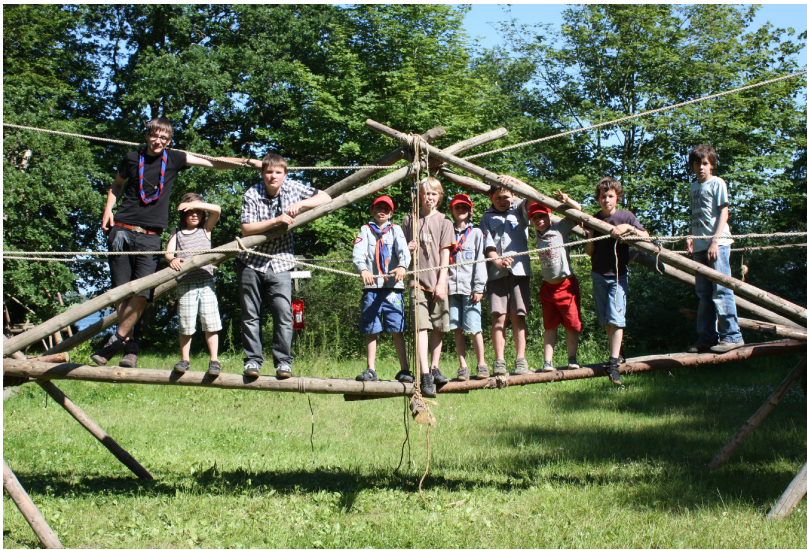
selbst ausgedacht, selbst gebaut, selbst erprobt ...